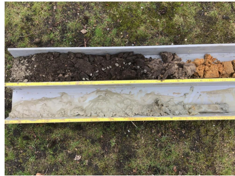
2021468, meetpunt 01 26546319

type grondboring datum 19-04-2021 boormeester Veldwerker x 183736.15 y 386733.79