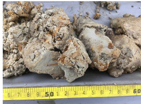
2021468, meetpunt 01, laag 140-180 26546321